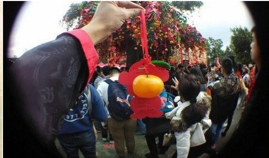
Tết Trùng Cửu Ném Cam Cầu May Mắn, Tình Duyên.