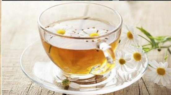
Uống Trà Hoa Cúc Mang Ý Nghĩa Trường Thọ

Tết Trùng Cửu còn được người Hoa gọi là Tết người cao tuổi, Tết người già. Vào dịp này, khắp nơi ở Trung Quốc đều tổ chức các hoạt động với đề tài kính lão, trọng già. Với họ, việc kính trọng, quan tâm và chăm sóc người già, người cao tuổi là trách nhiệm, nghĩa vụ của mỗi người con, mỗi gia đình, mỗi vùng miền nói riêng và cả nước Trung Quốc nói chung.