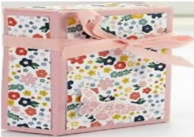
Hộp quà sinh nhật