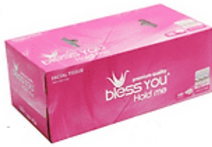
Hộp khăn giấy