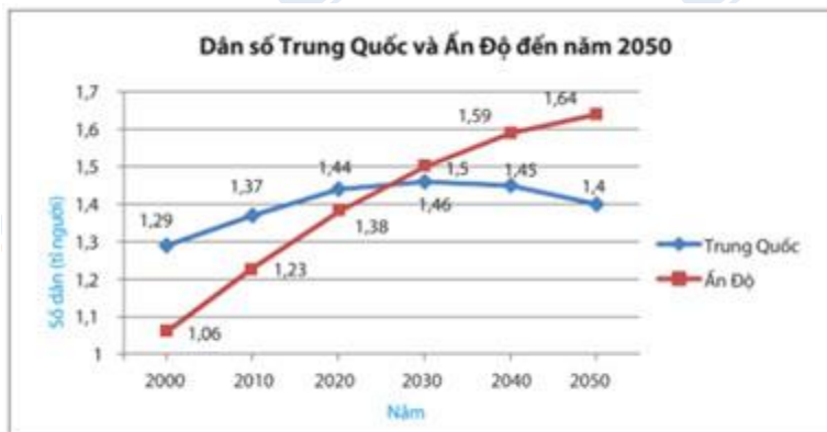
Hình 5.40. (Theo worldometers.info)

Biểu đồ đoạn thẳng Hình 5.40 cho biết số dân và dự báo quy mô dân số của Trung Quốc và Ấn Độ đến năm 2050.