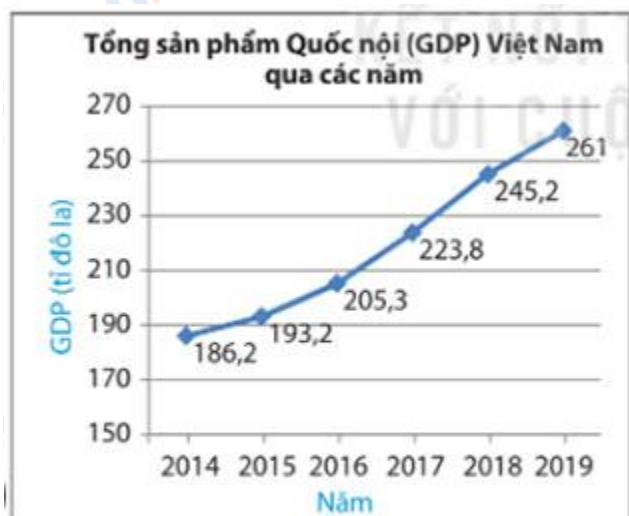
Hình 5.38a (Theo Ngân hàng Thế giới)