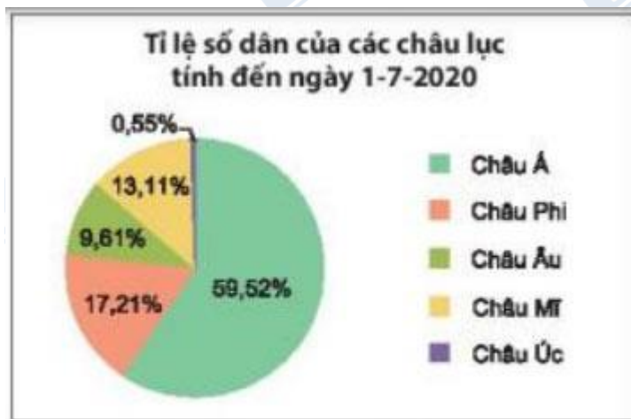
Hình 5.18. (Theo Báo cáo dân số năm 2020 của Liên Hợp Quốc)