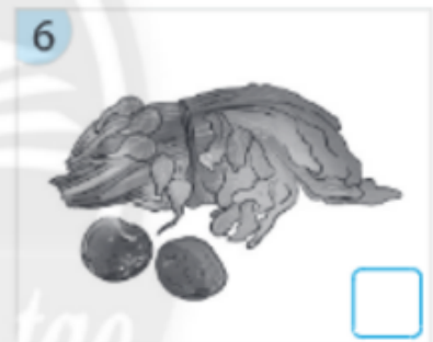
Rau củ quả đang thối