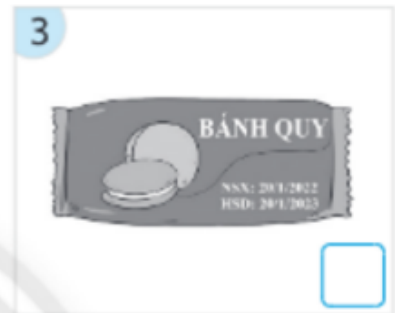
Bánh kẹo có nhãn mác rõ ràng