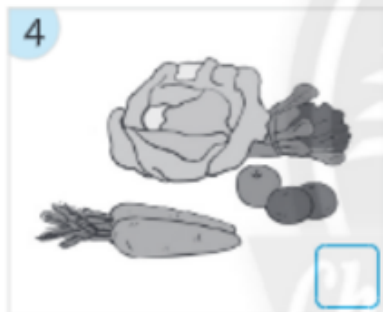
Rau củ quả tươi