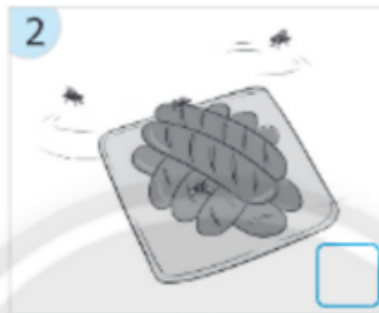
Xúc xích nướng