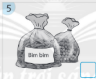
Bim bim cần