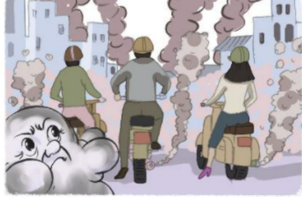
Khói bụi thành phố