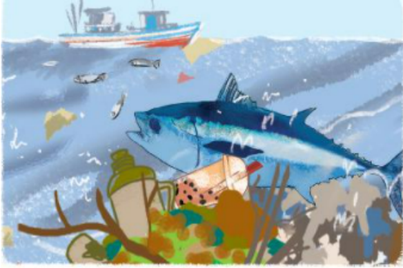
Sự cố tràn dầu ra biển