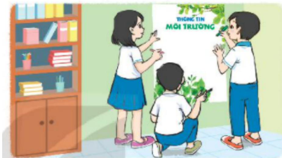
Làm bảng Thông tin môi trường