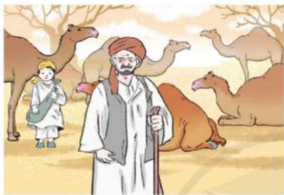
Chăn nuôi lạc đà