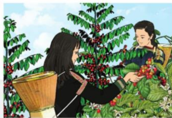
Thu hái cà phê