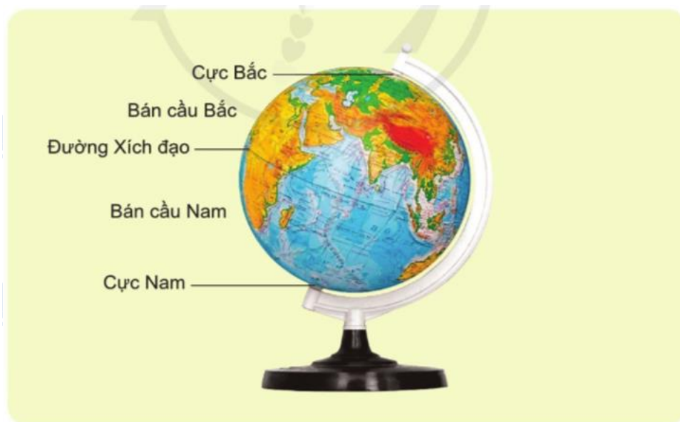
Quả địa cầu