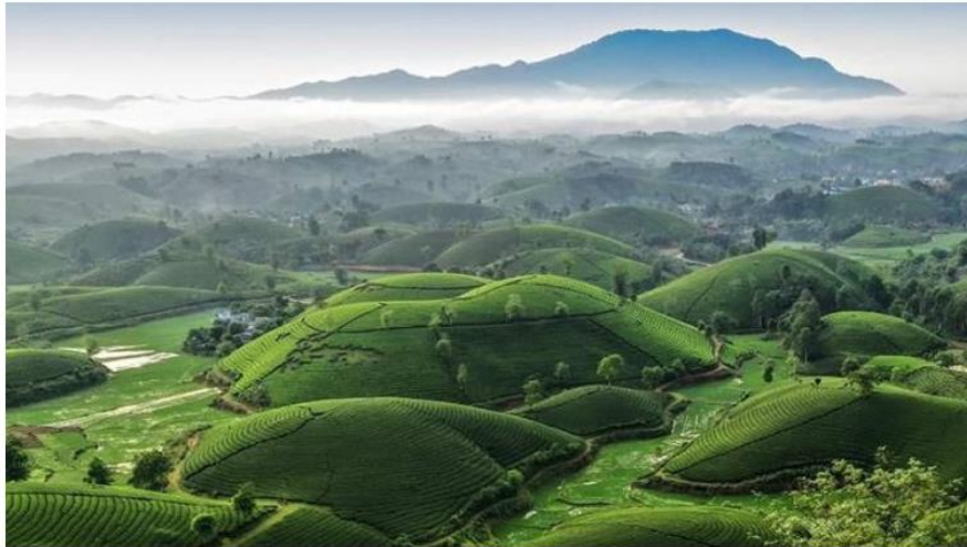
- Cao nguyên