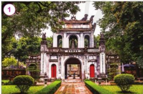
Văn Miếu – Quốc Tử Giám, Thủ đô Hà Nội