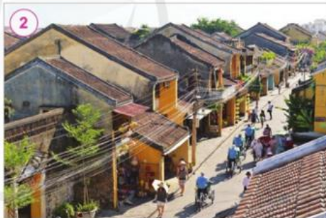
Phố cổ Hội An, tỉnh Quảng Nam