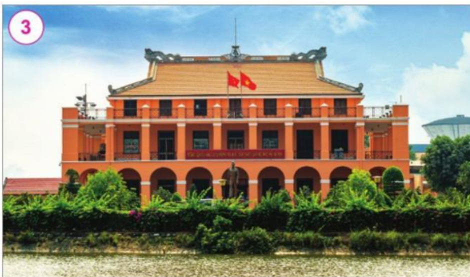
Bến Nhà Rồng, Thành phố Hồ Chí Minh