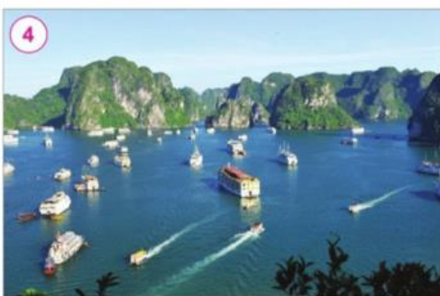
Vịnh Hạ Long, tỉnh Quảng Ninh