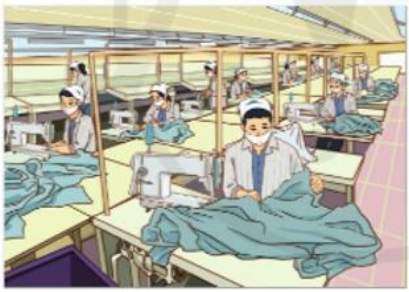
1 May mặc