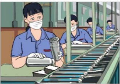
3 Sản xuất phích nước