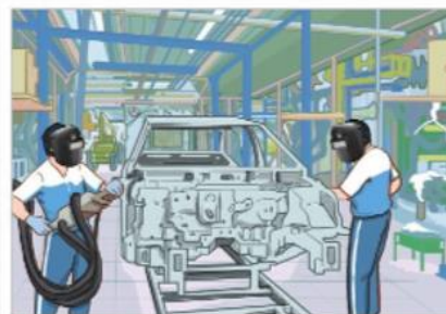
4 Sản xuất ô tô