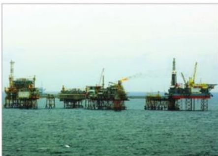
5 Khai thác dầu khí