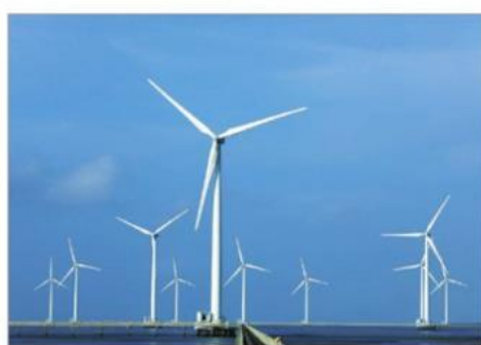
6 Sản xuất điện gió