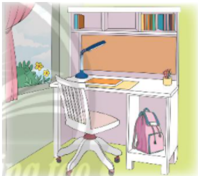
Hình 4. Góc học tập ở nhà của bạn Lan

Giải Tin học lớp 3 trang 73 Luyện tập 1: Bạn Lan cần chuyển sách, vở, đồ dùng học tập, đèn học,... (Hình 4) sang bàn học ở vị trí mới. Theo em bạn Lan nên chia công việc này thành những việc nhỏ nào để thực hiện.