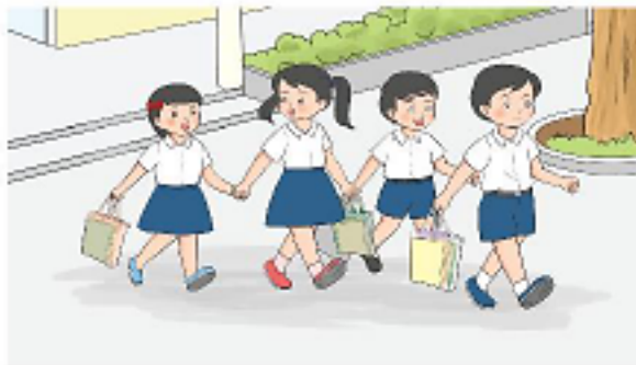
Hình 2b. Các bạn chia sách vào các túi nhỏ để vận chuyển