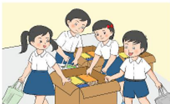
Hình 2a. Các bạn tìm cách chuyển thùng sách to và nặng