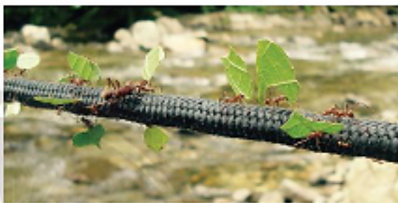
Hình 1b. Các chú kiến tha từng mảnh lá nhỏ về tổ