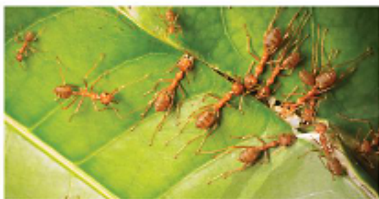
Hình 1a. Đàn kiến tìm cách tha lá to về tổ

Giải Tin học lớp 3 trang 72 Khởi động: Em hãy cho biết đàn kiến ở Hình 1a và Hình 1b đã làm thế nào để đưa được chiếc lá to về tổ?