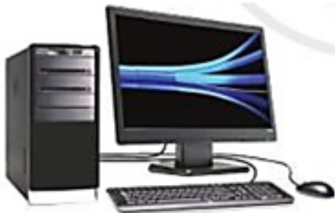
Hình 1. Máy tính để bàn

Tin học lớp 3 trang 8 Hoạt động 2: Em hãy chỉ ra thân máy, màn hình, bàn phím và chuột của từng loại máy tính trong các Hình 1, 2, 3 và 4 dưới đây.