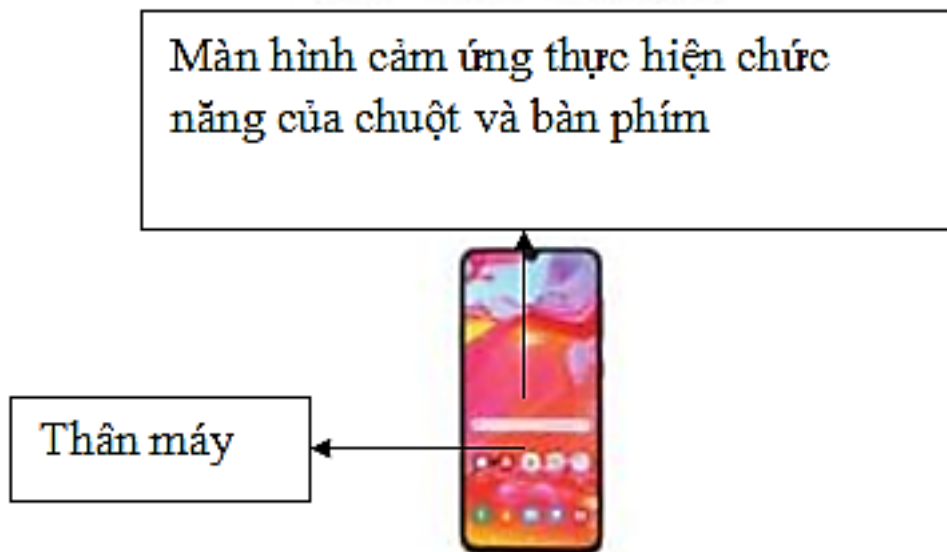
Hình 3. Điện thoại thông minh