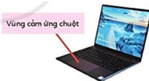
Hình 2. Máy tính xách tay