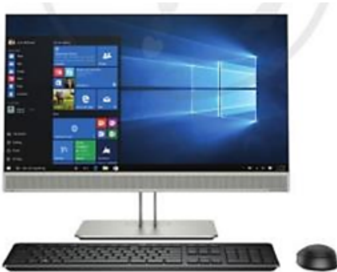
Hình 5. Một máy tính để bàn All in one ("All in one" nghĩa là "tất cả trong một")

Tin học lớp 3 trang 9 Vận dụng: Hình 5 dưới đây là một chiếc máy tính để bàn. Em thấy nó có những điểm gì khác so với những máy tính để bàn thông thường?