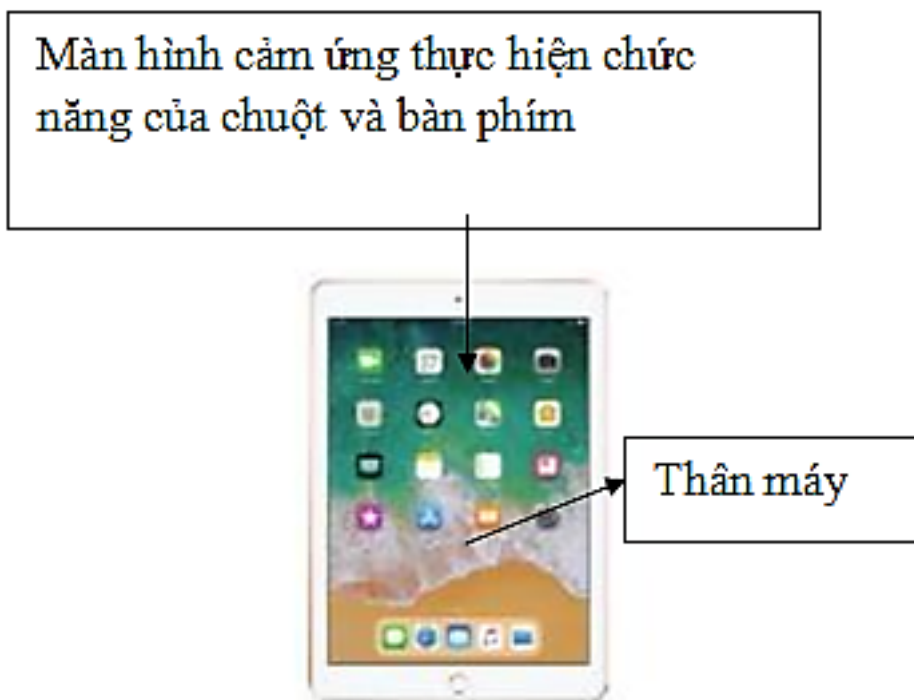
Hình 4. Máy tính bảng

Tin học lớp 3 trang 9 Luyện tập: Trong các câu sau, câu nào đúng?