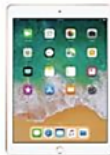
Hình 4. Máy tính bảng