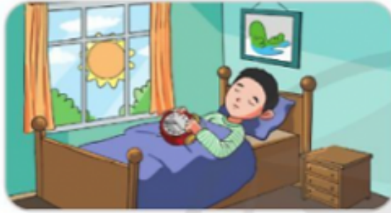
Chuông báo thức kêu lên, Sơn dậy tắt chuông rồi ngủ tiếp.