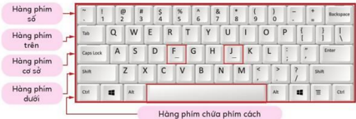
Hình 2. Khu vực chính của bàn phím

Giải Tin học lớp 3 trang 26 Bài 2: Nếu muốn gõ từ "TIN HOC", em cần sử dụng các phím ở những hàng phím nào?