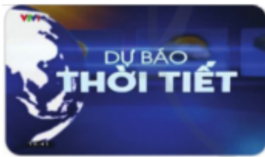
Hình 1. Chương trình dự báo thời tiết

Tin học lớp 3 trang 33 Hoạt động 1: Các Hình 1, 2 và 3 được cắt từ các video có trên Internet. Mỗi hình này cho em biết thông tin gì?