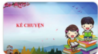
Hình 3. Kể chuyện lớp 3