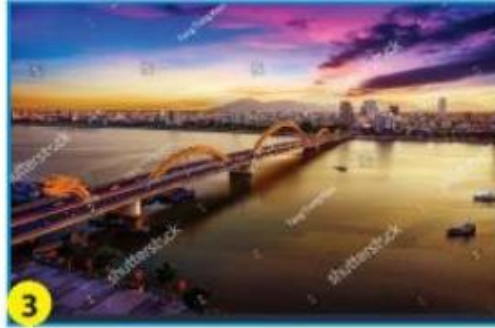
Sông Hàn (Đà Nẵng)