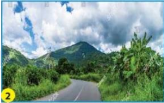
Núi Bà Đen (Tây Ninh)