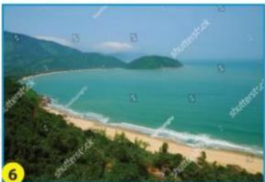
Biển Lăng Cô (Thừa Thiên Huế)