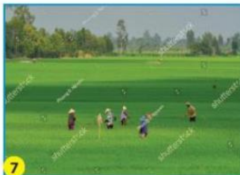
Đồng bằng Sông Cửu Long