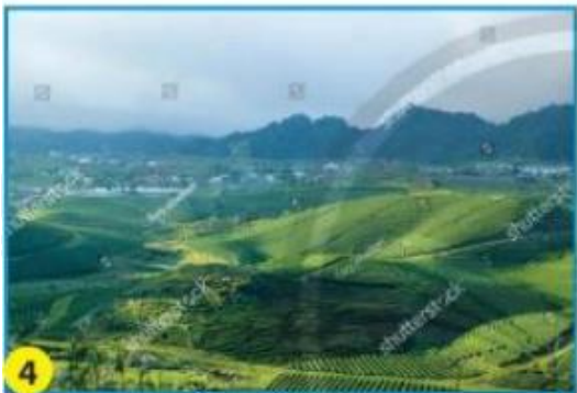
Cao nguyên Mộc Châu (Sơn La)