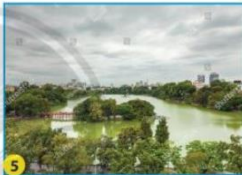
Hồ Hoàn Kiếm (Hà Nội)