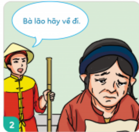
Lá đơn viết lí lẽ rõ ràng, nhưng quan không đọc được vì chữ quá xấu.