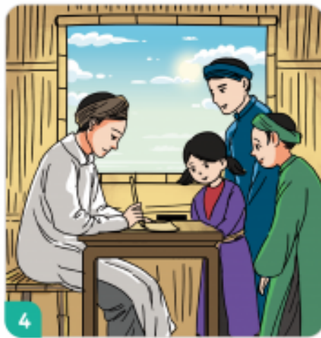
Mấy năm sau, mọi người đều kính trọng ông vì văn hay chữ tốt.

(Theo Bảo Linh, Chuyện kể về tấm gương Đạo đức , NXB Hồng Đức, 2019)