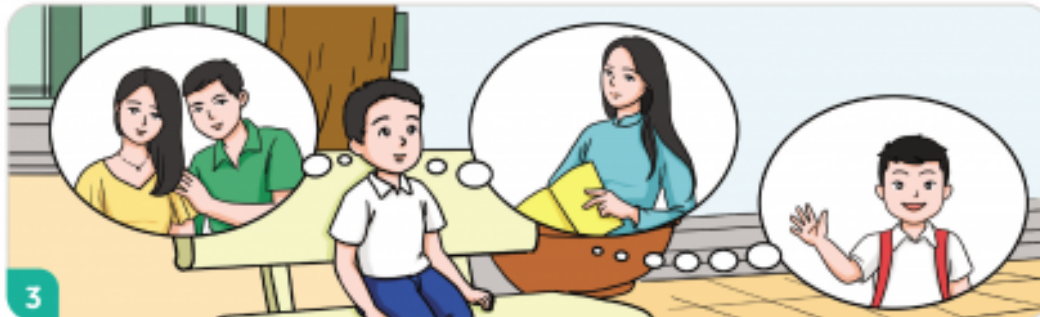
Lắng nghe ý kiến từ người thân, thầy cô và bạn bè