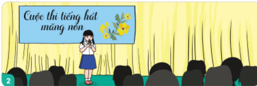
Tích cực tham gia các hoạt động