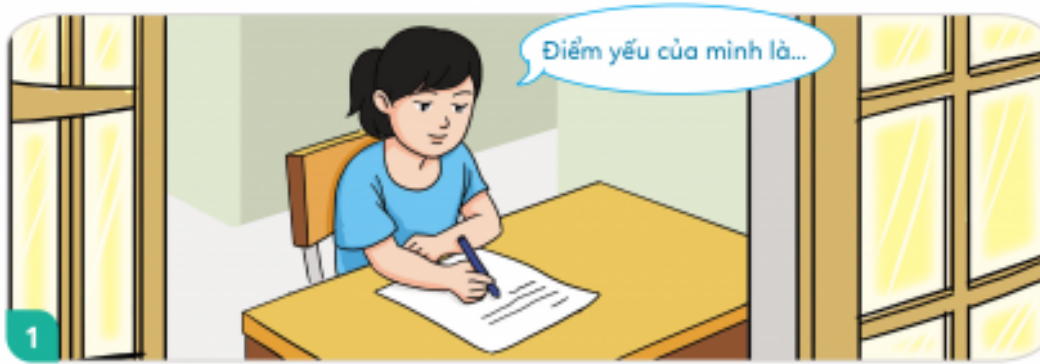
Tự suy nghĩ và liệt kê ra điểm mạnh, điểm yếu của bản thân