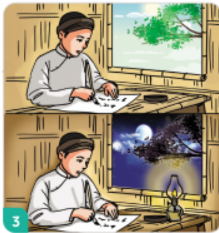
Cao Bá Quát quyết tâm luyện chữ.