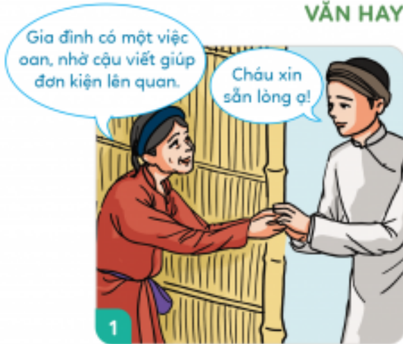
Cao Bá Quát là người nổi tiếng văn hay.