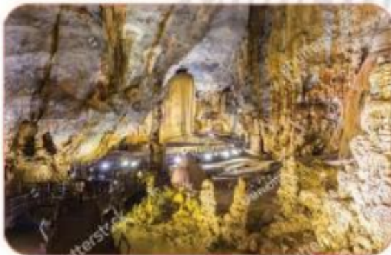
động Thiên Đường