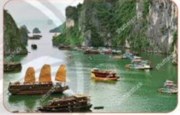
vịnh Hạ Long