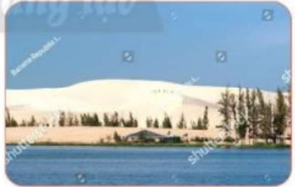
đồi cát trắng