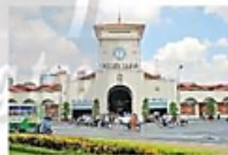
Thành phố Hồ Chí Minh