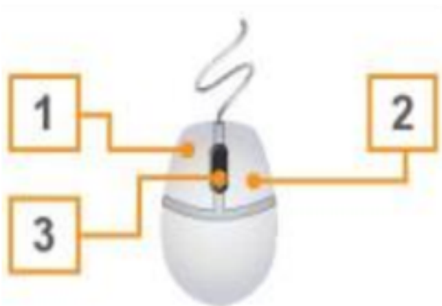
Hình 20. Chuột máy tính

Em hãy quan sát Hình 20 và ghép các cụm từ nút trái , nút phải , nút cuộn tương ứng với các bộ phận được đánh số của chuột máy tính.