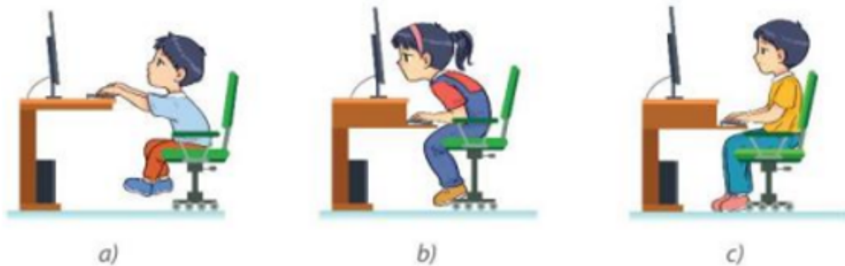
Hình 18. Các tư thế ngồi khi sử dụng máy tính

Tư thế ngồi khi sử dụng máy tính của bạn nào sau đây chưa đúng? Vì sao?