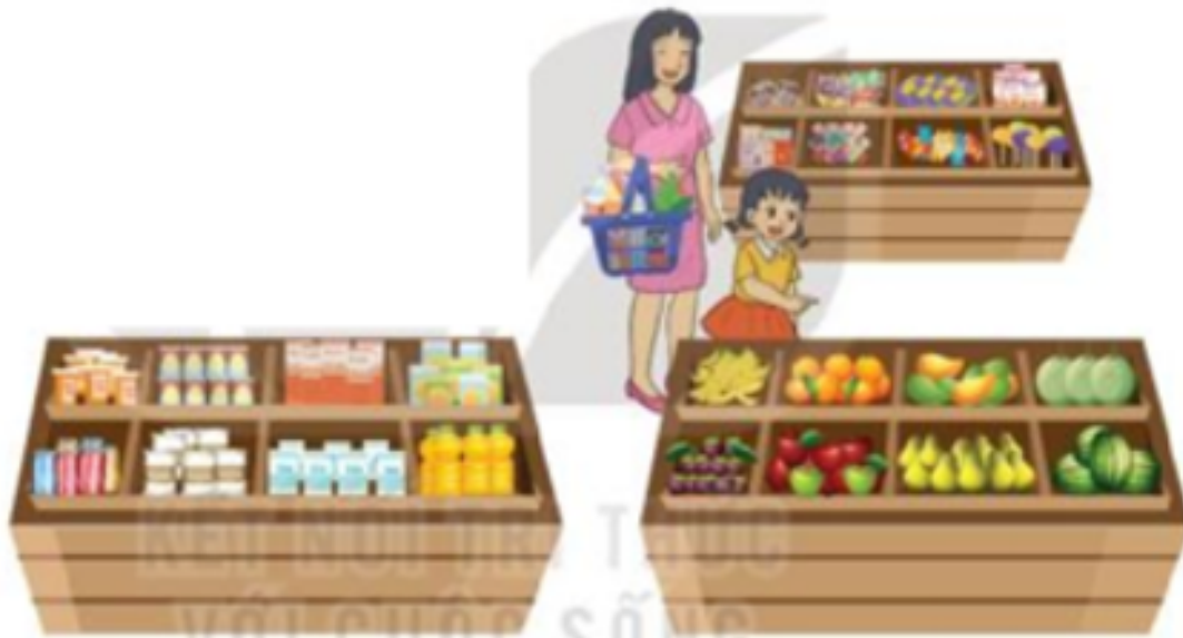
Hình 40. Trong cửa hàng

Khởi động trang 34 Tin học lớp 3: Trong cửa hàng có rất nhiều mặt hàng. Theo em chủ cửa hàng đã làm gì để khách hàng có thể tìm kiếm mặt hàng nhanh hơn?