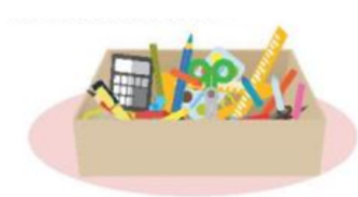
Hình 41. Đồ dùng chưa được sắp xếp