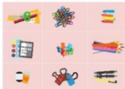
Hình 42. Đồ dùng được sắp xếp