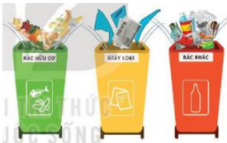
Hình 85. Phân loại rác