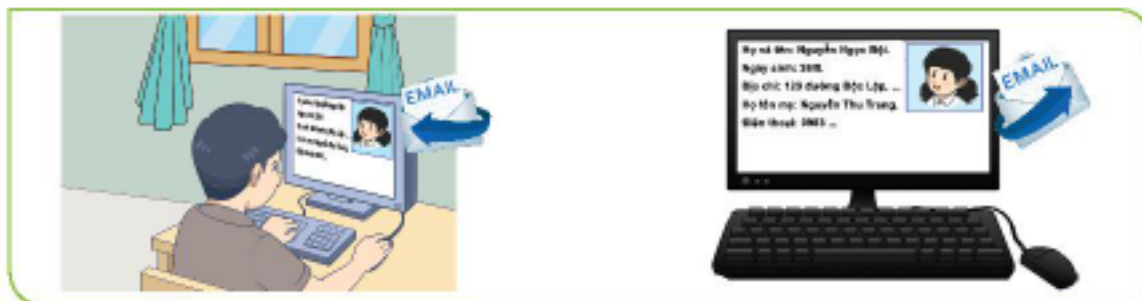
Hình 2a. Trao đổi thông tin qua thư điện tử

Quan sát Hình 2 và cho biết thông tin cá nhân, gia đình có thể được trao đổi nhờ máy tính bằng cách nào?