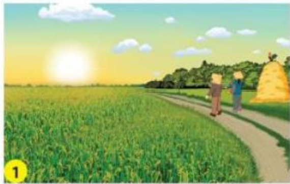
1 Buổi sáng, Mặt Trời mọc ở phương đông.