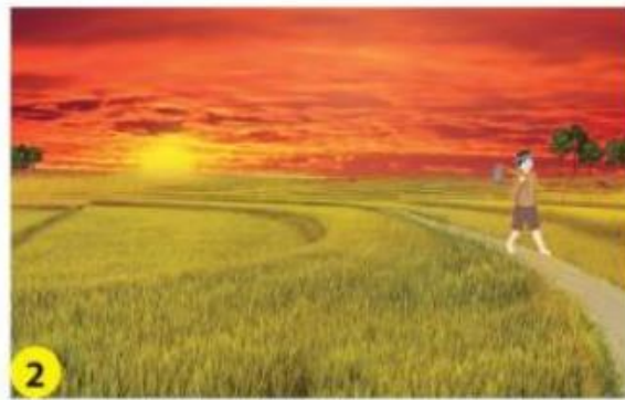
2 Buổi chiều, Mặt Trời lặn ở phương tây.