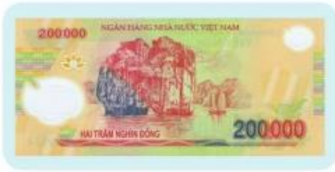
Hai trăm nghìn đồng