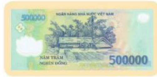
Năm trăm nghìn đồng

b) Thảo luận nhóm, kể một số đồ vật có giá bán khoảng hai trăm nghìn đồng, năm trăm nghìn đồng mà em biết.