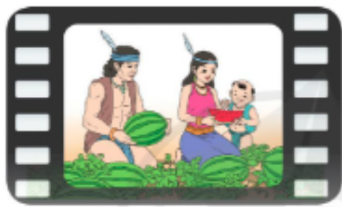
Phim Sự tích trái dưa hấu