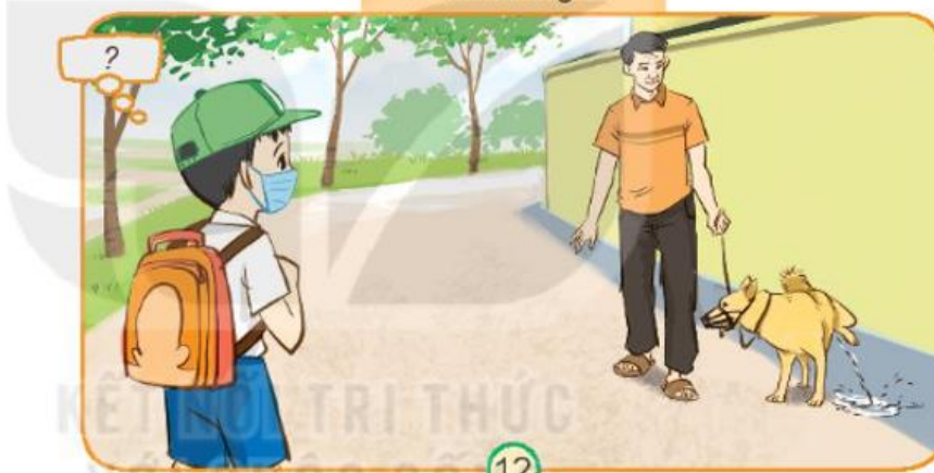
Tình huống 2