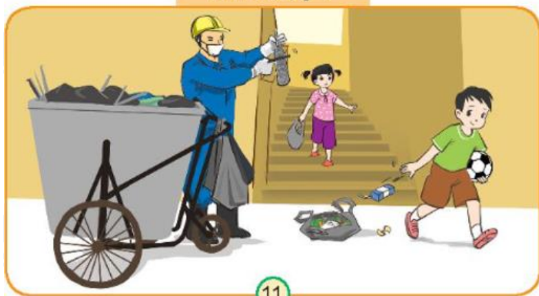
Tình huống 1

Giải Tự nhiên xã hội lớp 3 Bài 3 trang 19 Câu 1: Nếu gặp tình huống sau, em sẽ nói và làm gì?