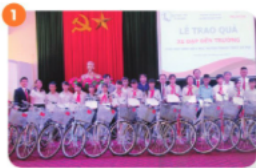
Tặng xe đạp

Câu 1 trang 67 SGK Tiếng Việt lớp 3 Tập 1: Quan sát và cho biết em thấy gì trong mỗi hình ảnh dưới đây: