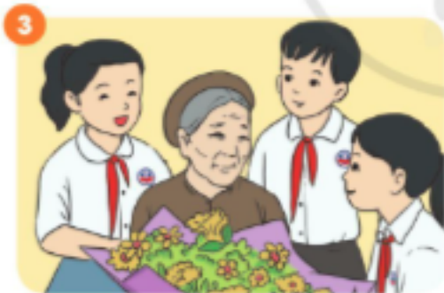
Thăm Bà mẹ Việt Nam anh hùng