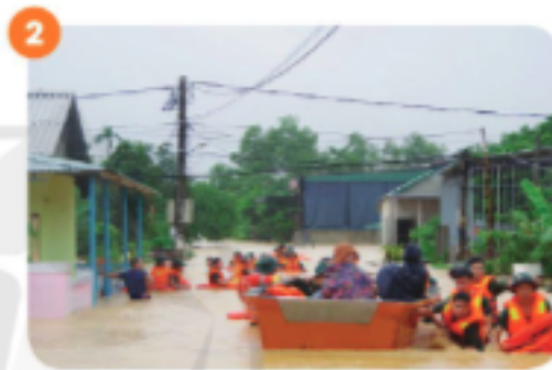
Bộ đội giúp dân