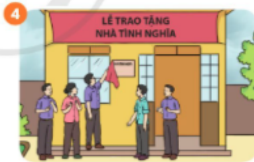
Trao tặng nhà tình nghĩa