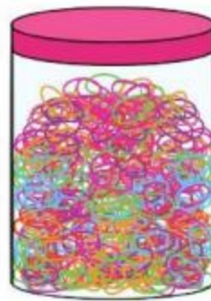
C. 2 030 dây