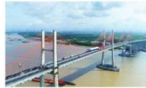
Cầu Bạch Đằng nối hai tỉnh Quảng Ninh và Hải Phòng dài: 3 054 m