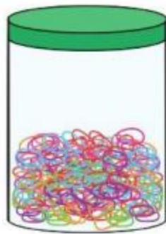
B. 950 dây