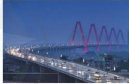
Cầu Nhật Tân ở thành phố Hà Nội dài: 3 900 m