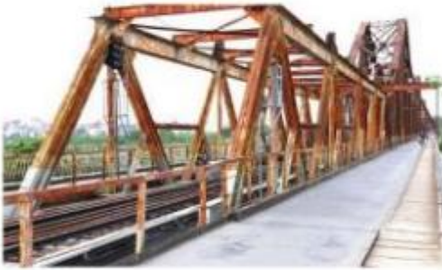
Cầu Long Biên ở thành phố Hà Nội dài: 2 290 m