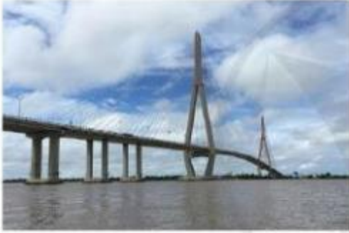
Cầu Cần Thơ nối liền thành phố Cần Thơ với tỉnh Vĩnh Long dài: 2 750 m