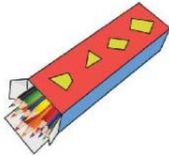
Hộp bút của em

Cắt một số hình, dán trên các mặt của hộp để trang trí.