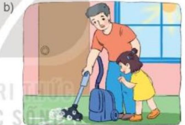
Mi cùng bố hút bụi lúc: