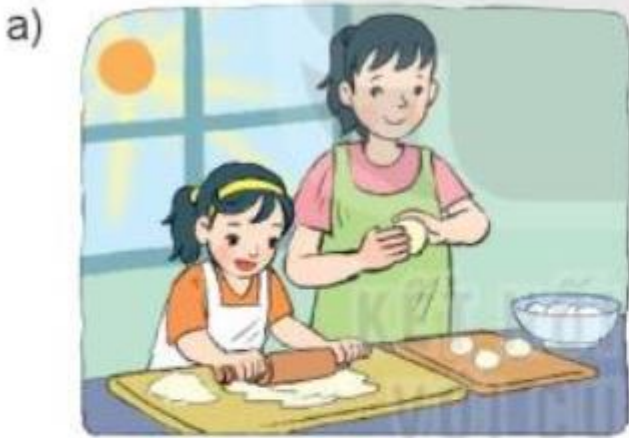
Mai cùng mẹ làm bánh lúc:

Giải Toán lớp 3 Tập 2 trang 78 Bài 3: Chọn đồng hồ thích hợp với mỗi bức tranh: