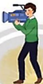
người quay phim