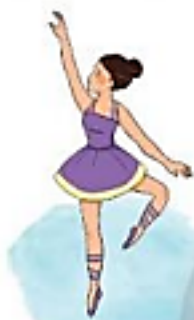
diễn viên múa