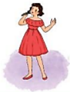
M: ca sĩ – hát