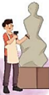
nhà điêu khắc