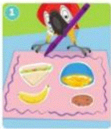
1. Draw and color.