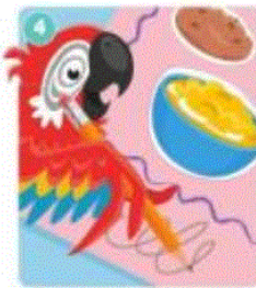
4. Write your name.