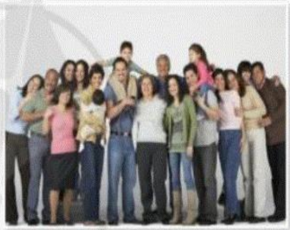
1. The grandfather _____.