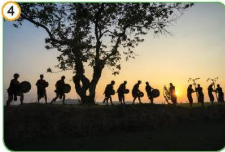
Không gian văn hoá cồng chiêng Tây Nguyên