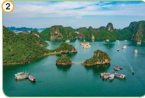
Vịnh Hạ Long, Quảng Ninh