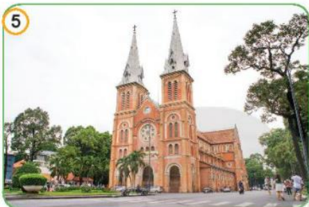
Nhà thờ Đức Bà, Thành phố Hồ Chí Minh