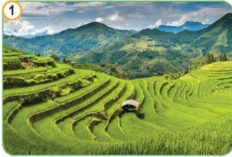
Ruộng bậc thang ở Hoàng Su Phì, Hà Giang