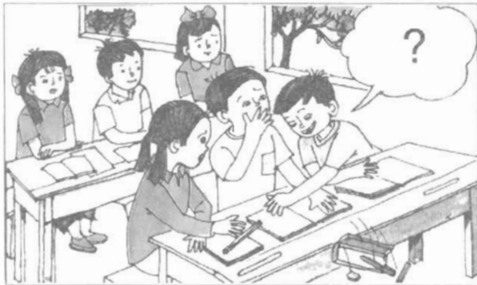
Tranh 2 : Hưng sợ ý làm rơi hộp bút của bạn.