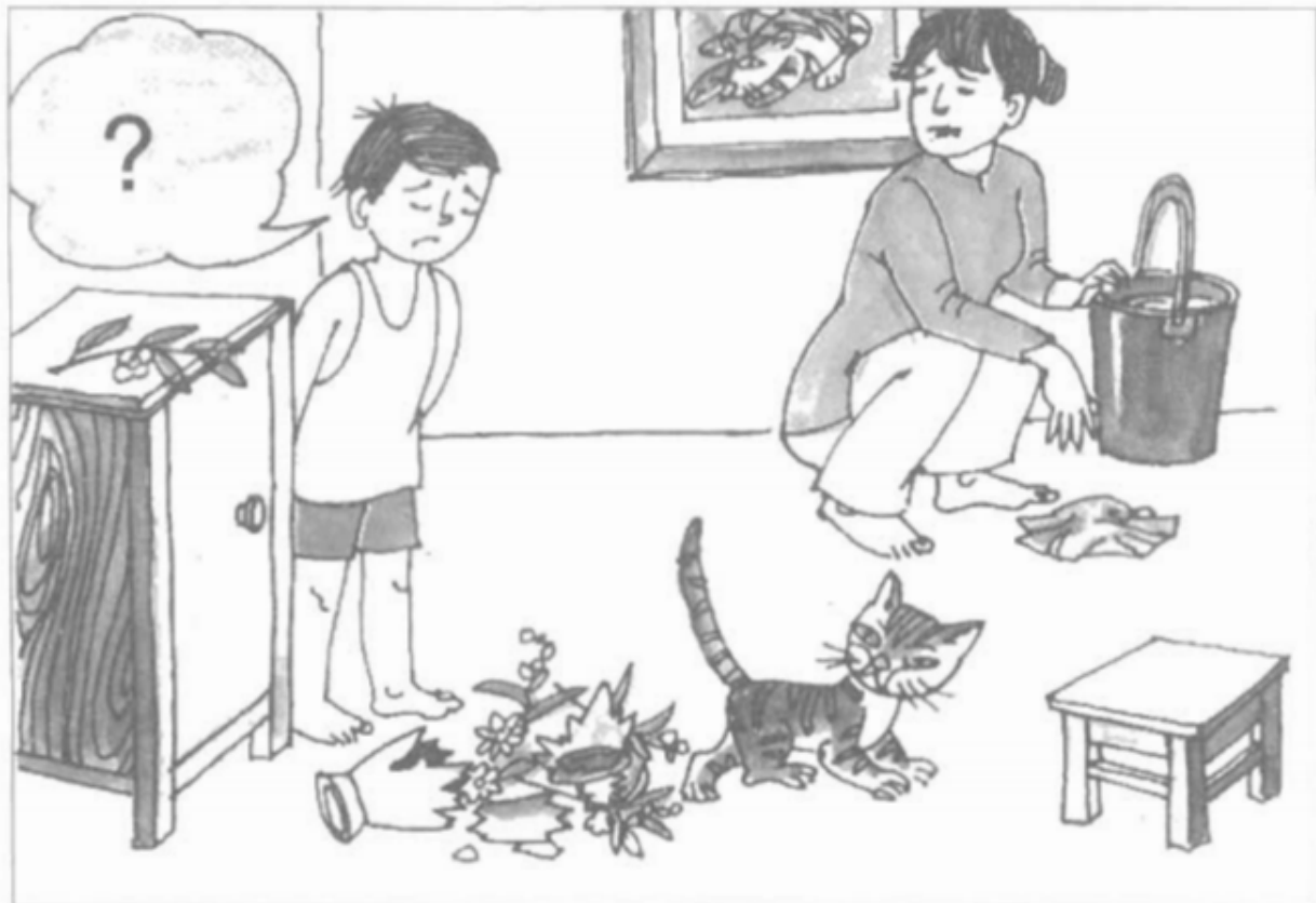
Tranh 4 : Tuấn sơ ý làm vỡ bình hoa.