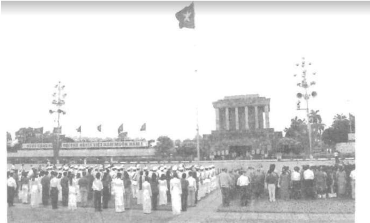
Ảnh 2 : Chào cờ ở Lăng Bác