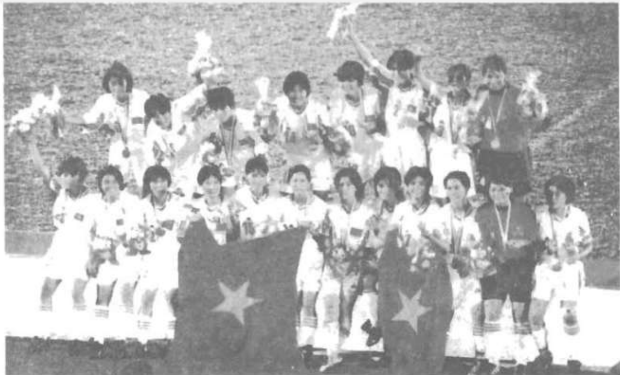
Ảnh 3 : Đội bóng đá nữ Việt Nam - vô địch SEA Games 21