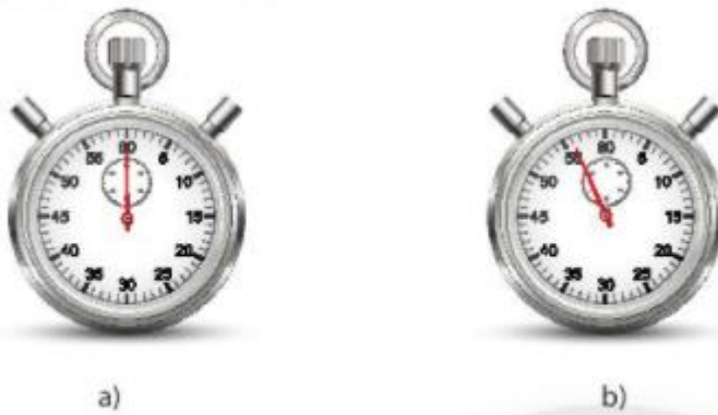
▲ Hình 6.2. Cách hiệu chỉnh đồng hồ

Em hãy quan sát hình 6.2 và cho biết cách hiệu chỉnh đồng hồ ở hình nào thì thuận tiện hơn khi thực hiện phép đo thời gian