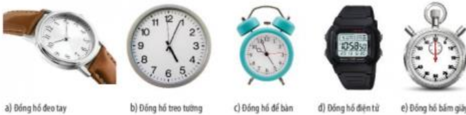
▲ Hình 6.1. Một số loại đồng hồ

Ngoài những loại đồng hồ được liệt kê trong hình 6.1, hãy kể thêm một số loại đồng hồ mà em biết và nêu ưu thế của từng loại