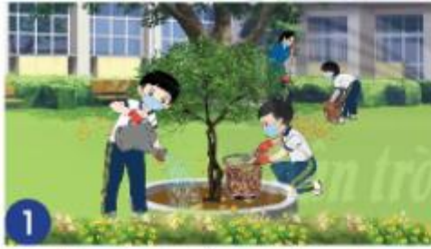
1 Lớp Nam thực hành chăm sóc cây ở vườn trường.