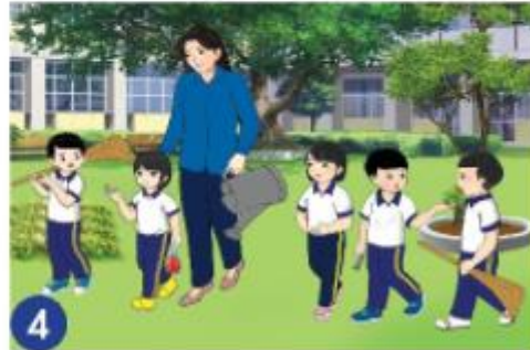
4 Các bạn dọn dẹp vệ sinh, cất dụng cụ lao động gọn gàng.

2. Em học được điều gì từ câu chuyện đó?