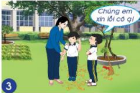
3 Cô giáo nhắc nhở hai bạn.