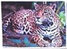
báo hoa mai

Hổ, báo hoa mai, tê giác, gấu ngựa, gấu chó là những động vật quý hiếm, cần được bảo vệ.