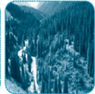
nhọn hoát, hoắt