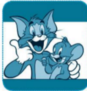
hoạt / hoạt hình