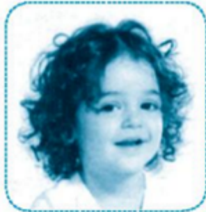
tóc xoan, xoăn