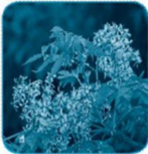
hoa xoan / xoăn