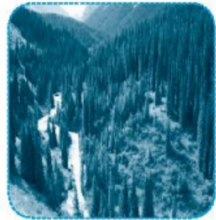
nhọn hoát/ hoắt