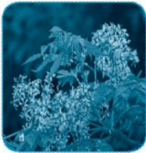
hoa xoan/ xoăn