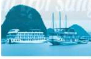
nơi tránh bão