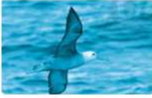
chim hải âu