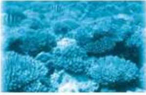
bãi san hô