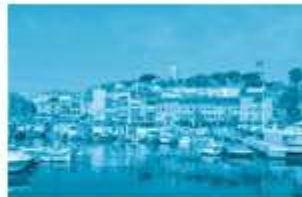
phố biển buổi ... áng