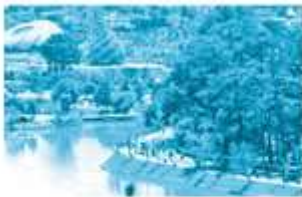
phố núi mùa ... uân