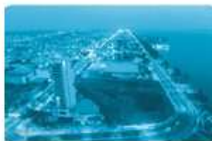
Thành phố Rạch giá