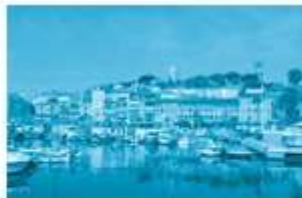
phố biển buổi . s áng