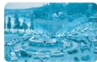
Thành phố Đà Lạt