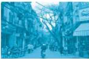
Phố cổ Hà Nội

Câu 2 (trang 62 VBT Tiếng Việt lớp 1 Tập 2): Viết tên một bức ảnh mà em thích