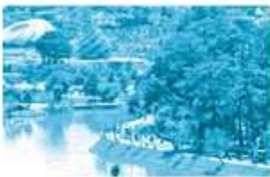
phố núi mùa . x uân