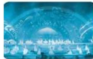
S . ân khẩu thành phố

Câu 2 (trang 63 VBT Tiếng Việt lớp 1 Tập 2):