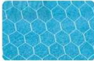
l... bóng đá