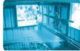
khung c... dẹt lụ