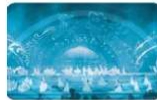
... ân khẩu thành phố