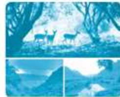
...ừng Cúc Phương