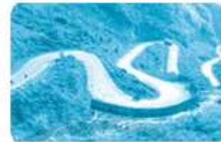
con đường khúc khuỷu