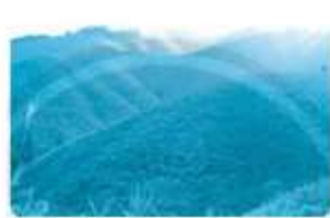
đồi n úi