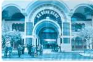
G a Đồng Đăng