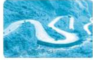
con đường kh... khuỷu