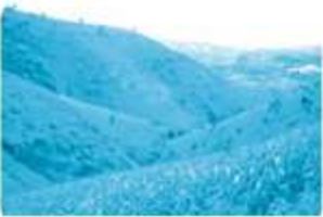
N ương rẫy