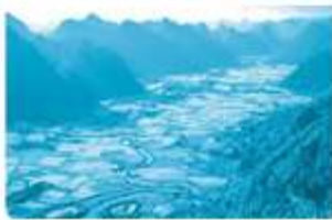
thung l ũng