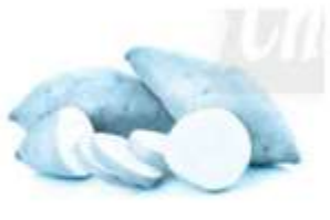
củ khoai l...