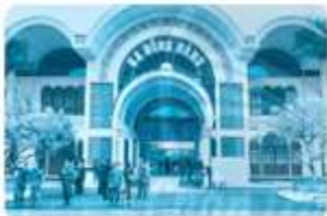
... a Đồng Đăng