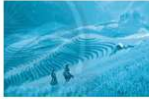
R uộng bậc thang Sa Pa