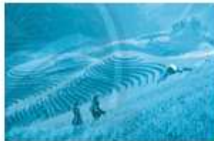
...uộng bậc thang Sa Pa