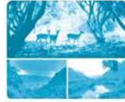
R ừng Cúc Phương