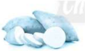
củ khoai lang