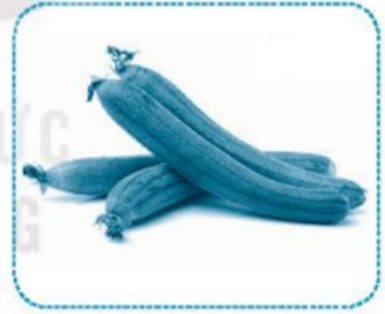
quả m ướp