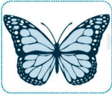
con b ướm