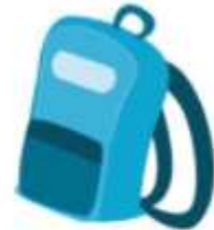
C ặp sách

Câu 3. (trang 48 VBT Tiếng Việt lớp 1 Tập 2):