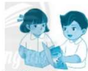
mở sách giáo khoa