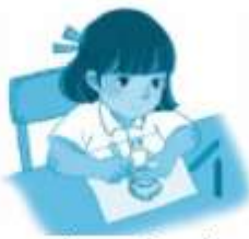
tô màu búp bê tóc xoắn