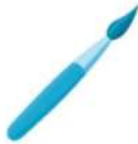
C ọ vẽ