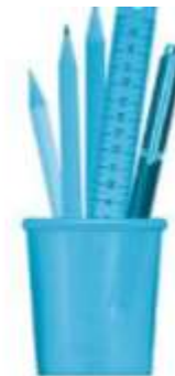
hộp ... c .ấm bút

Câu 2. (trang 49 VBT Tiếng Việt lớp 1 Tập 2):