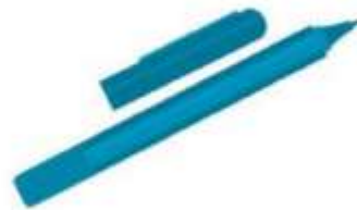
bút lông .. k .im