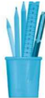
hộp .....ấm bút