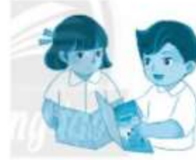
mở sách gi... khoa