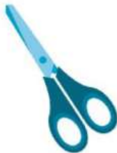
cái .. k .éo