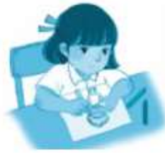
tô m... búp bê tóc xoắn