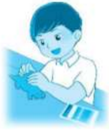
..N.ặn đất sét