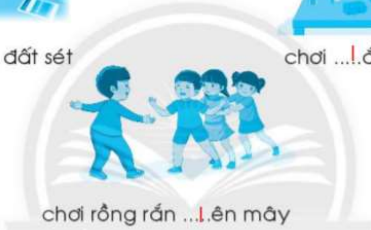
chơi rồ ng rắ n ...!..ên mây

Câu 2. (trang 42 VBT Tiếng Việt lớp 1 Tập 2):