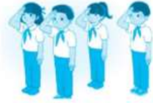
Nghỉ thức chào cờ