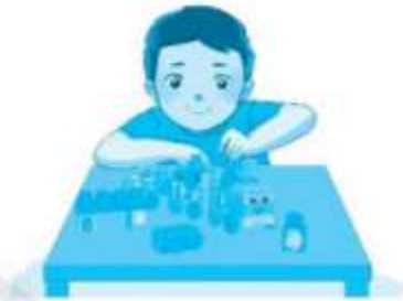
chơi ...!..ắp ráp