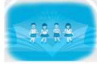
liên hoan văn nghệ