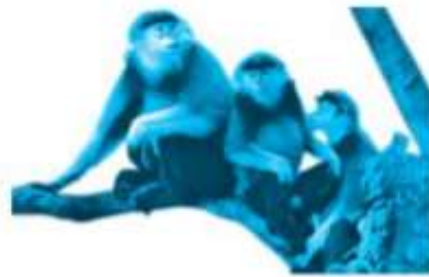
voọc ngu sắc