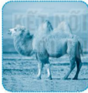
bướu lạc đà