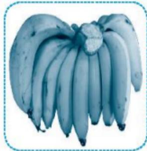
nải chuối ..