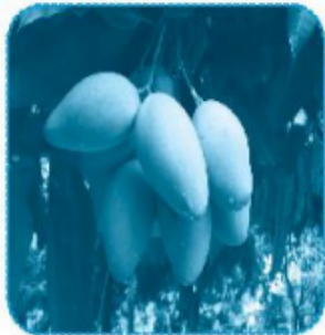
quả muối ..