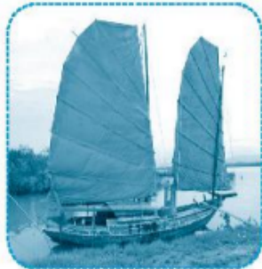
cánh buồm ..