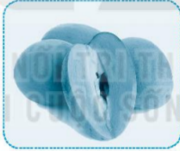
hồng x êm