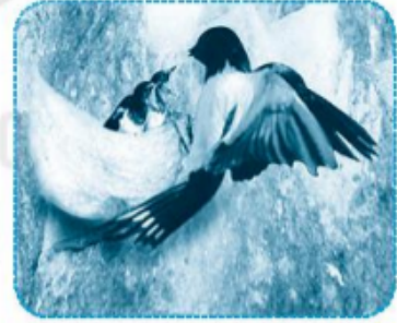
tổ yến ..

Câu 3 (trang 56 VBT Tiếng Việt lớp 1 Tập 1)