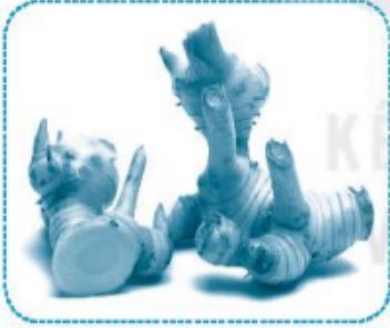
củ r iềng ..